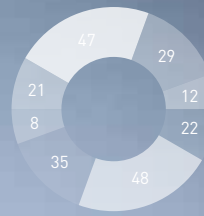
Wichtige Trends und Herausforderungen